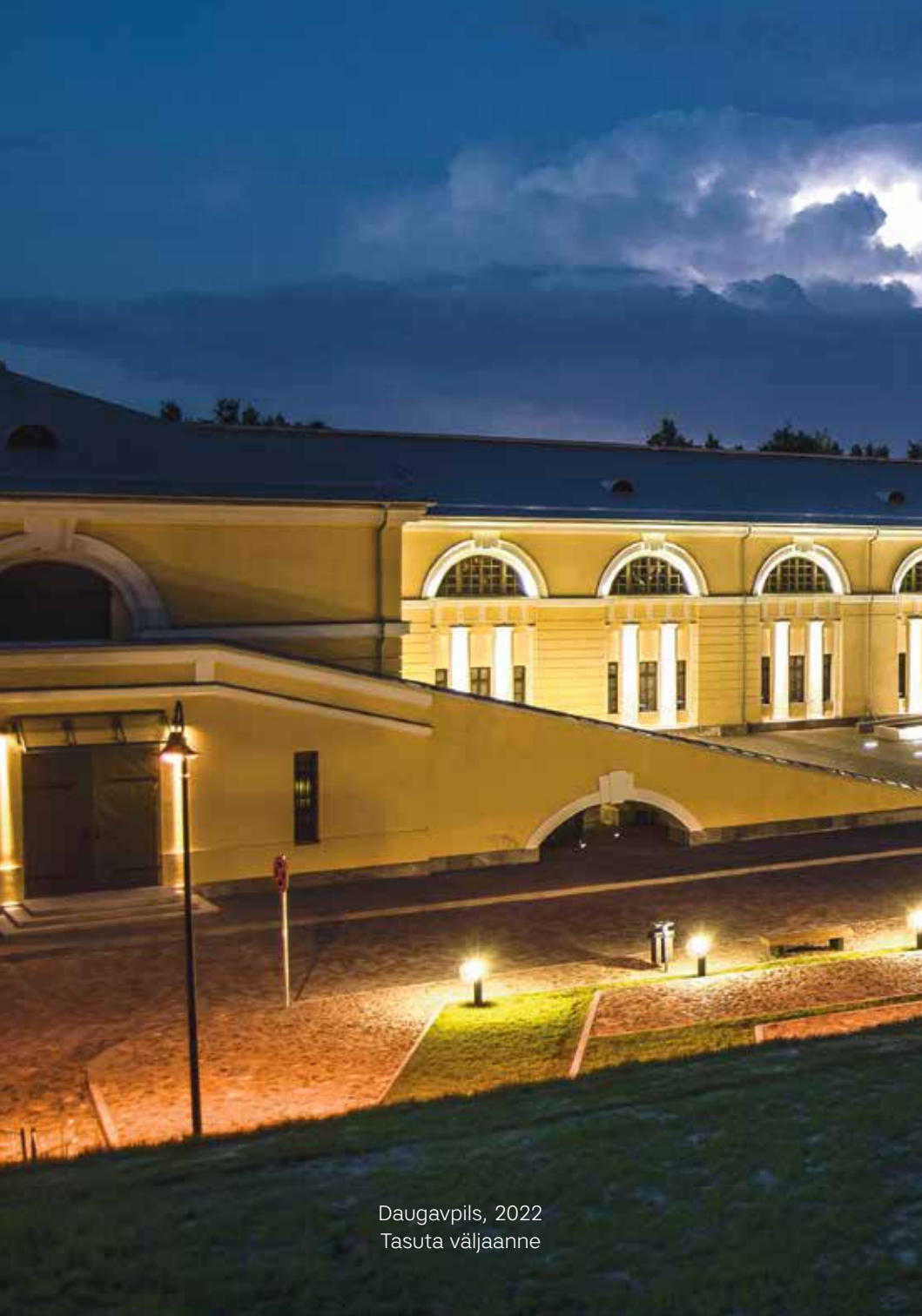
Daugavpils, 2022 Tasuta väljaanne